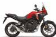
Nouveau coloris 2024 Grand Prix Red