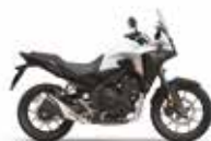
Nouveau coloris 2024 Pearl Horizon White