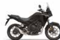
Nouveau coloris 2024 Mat Gunpowder Black Metallic